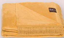
26 - CAFE LATTE