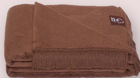
17 - DUNKELBROWN