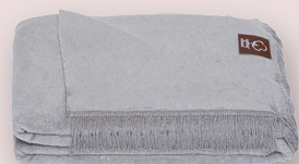
16 - WINDGLOCKEN