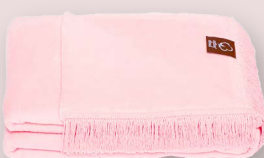
22 - ROSE PALIDO