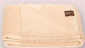
5 - J.BEŽ