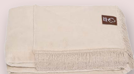
10 - SIMPLE TAUPE