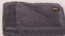
42 - ASCHE