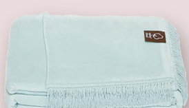
18 - CELESTE