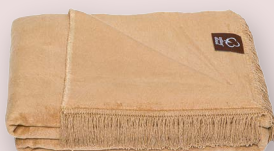
6 - BEŽ