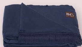
4 - MARINE