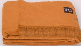
29 - LEDEBRAUN