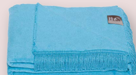
33 - HIMMEL