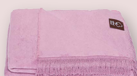
37 - LAVENDE