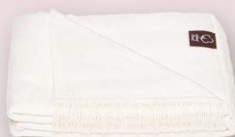
32 - BIAŁY