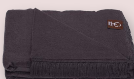
31 - ZINN