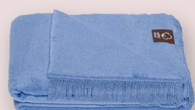
19 - NORDPOL