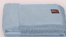
43 - MORSKI