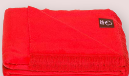
27 - CZERWONY