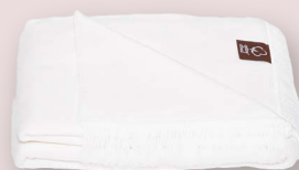
45 - ŚNIEŻKA