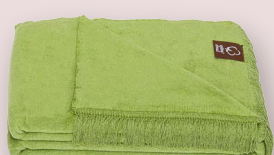
14 - PALME