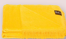
40 - ŻÓŁTY