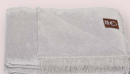
23 - ARGENTO