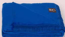
20 - AZULINA