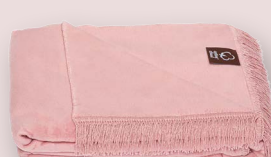
44 - BRUDNY RÓŻ