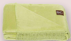
13 - ESPERANCE