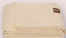
1 - TUSSAK