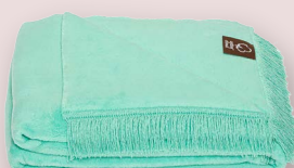
41 - MENTOS