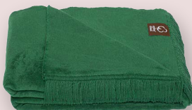
11 - LEAF