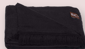
34 - CZARNY