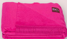
30 - PETUNIA