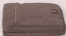
7 - ESPRESSO