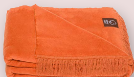
8 - GINGER