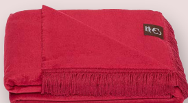
12 - BORDO