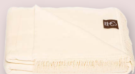
2 - ECRU