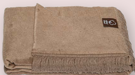
9 - SEPIA