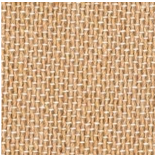
nicht gerautes Gewebe

Pflegehinweise: Feinwäsche- bzw. Wollmodus bis zu 30°C, trocknergeeignet